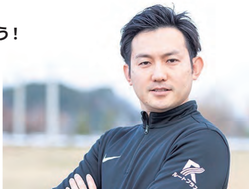
一般社団法人ルートプラス 代表理事